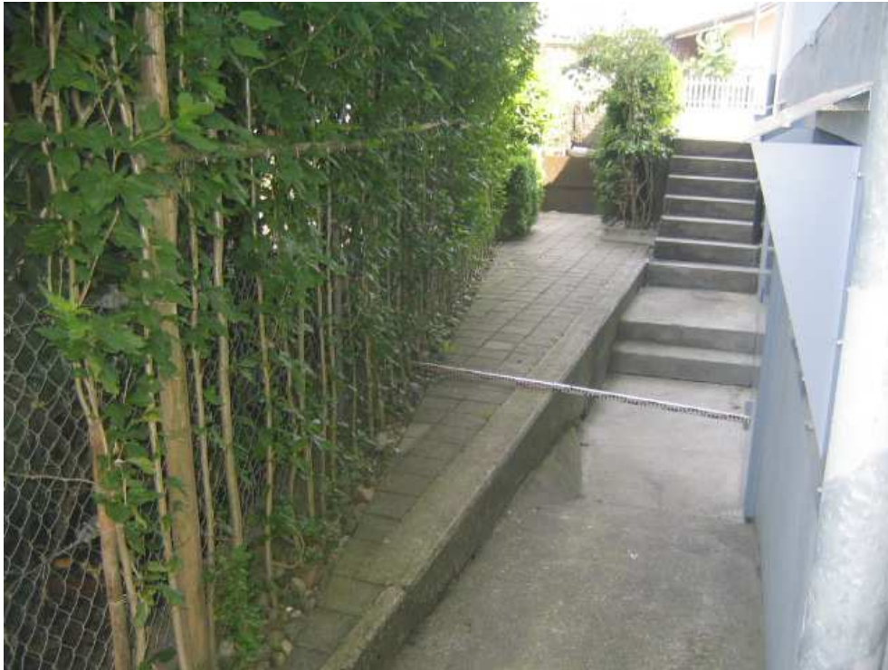
Foto 5: Bereich best. Leitung (sichtbar unterhalb Messlatte!) vor Unterquerung der Hauptstrasse