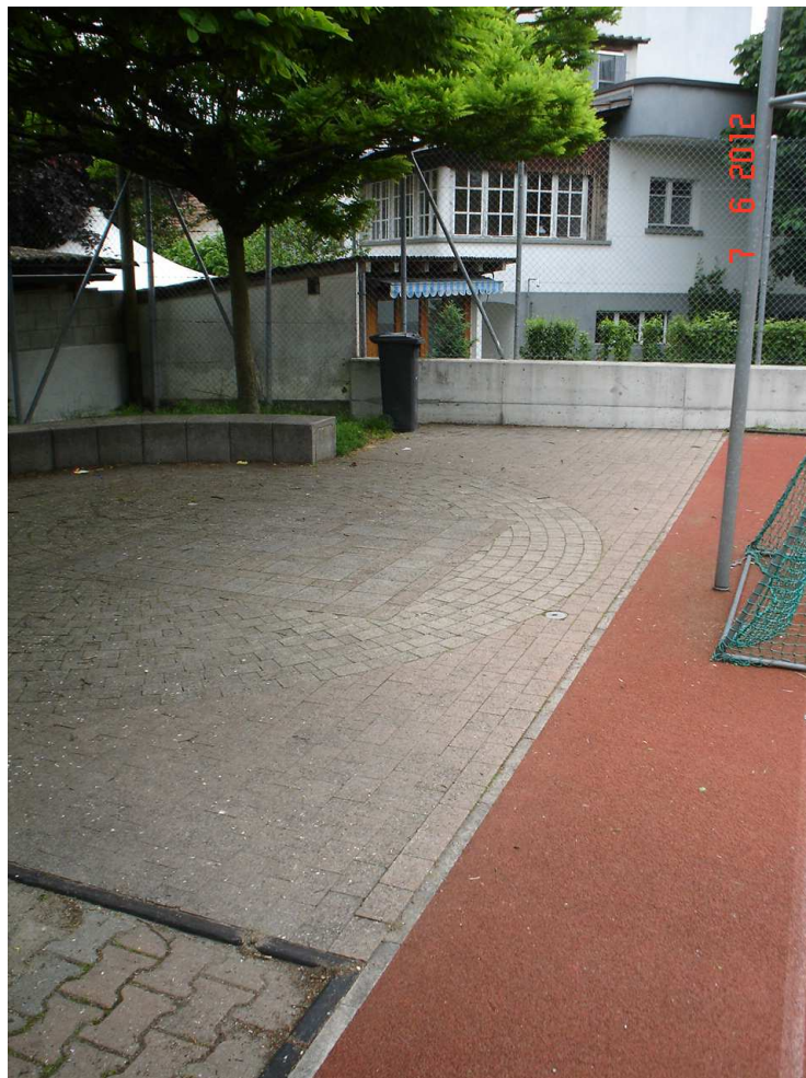
Foto 4: Ende Schulhausplatz, Bereich für projektieren Einlauf in best. Leitung (Blockrampe)