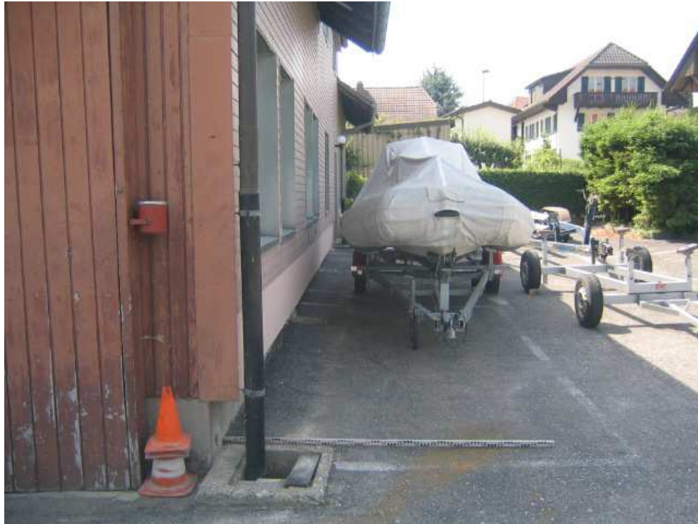
Foto 7: Werft, Bereich für Zugang Haus (links) und offenes Gerinne (Mitte)